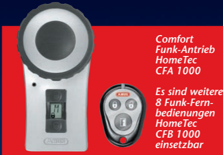
Comfort Funk-Antrieb HomeTec CFA 1000

Es sind weitere 8 Funk-Fernbedienungen HomeTec CFB 1000 einsetzbar