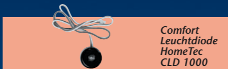
Comfort Leuchtdiode HomeTec CLD 1000