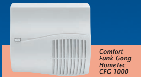
Comfort Funk-Gong HomeTec CFG 1000