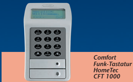
Comfort Funk-Tastatur HomeTec CFT 1000